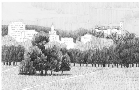
Skica: ©Aljaž Babič

»Misliti Tivoli – izzivi celovitega upravljanja mestnega parka«, posvet DKAS, Ustvarjalni center Švicarija, 12. oktober 2018 Partnerja pri izvedbi posveta sta MGLC – Ustvarjalni center Švicarija ter Oddelek za krajinsko arhitekturo Biotehniške fakultete Univerze v Ljubljani Dogodek je bil izveden s podporo Ministrstva za okolje in prostor, Mestne občine Ljubljana in donatorjev.