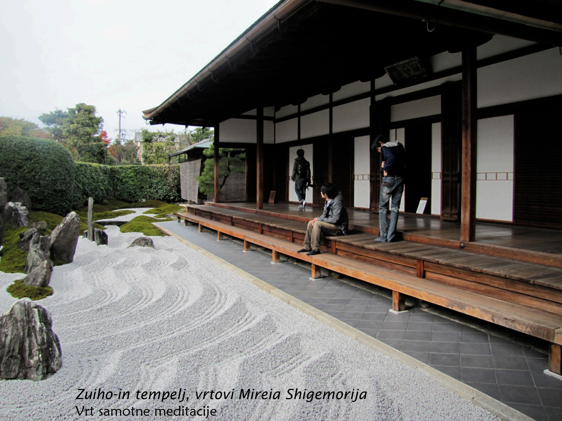
Zuiho-in tempelj, vrtovi Mireia Shigemoriya Vrt samotne meditacije