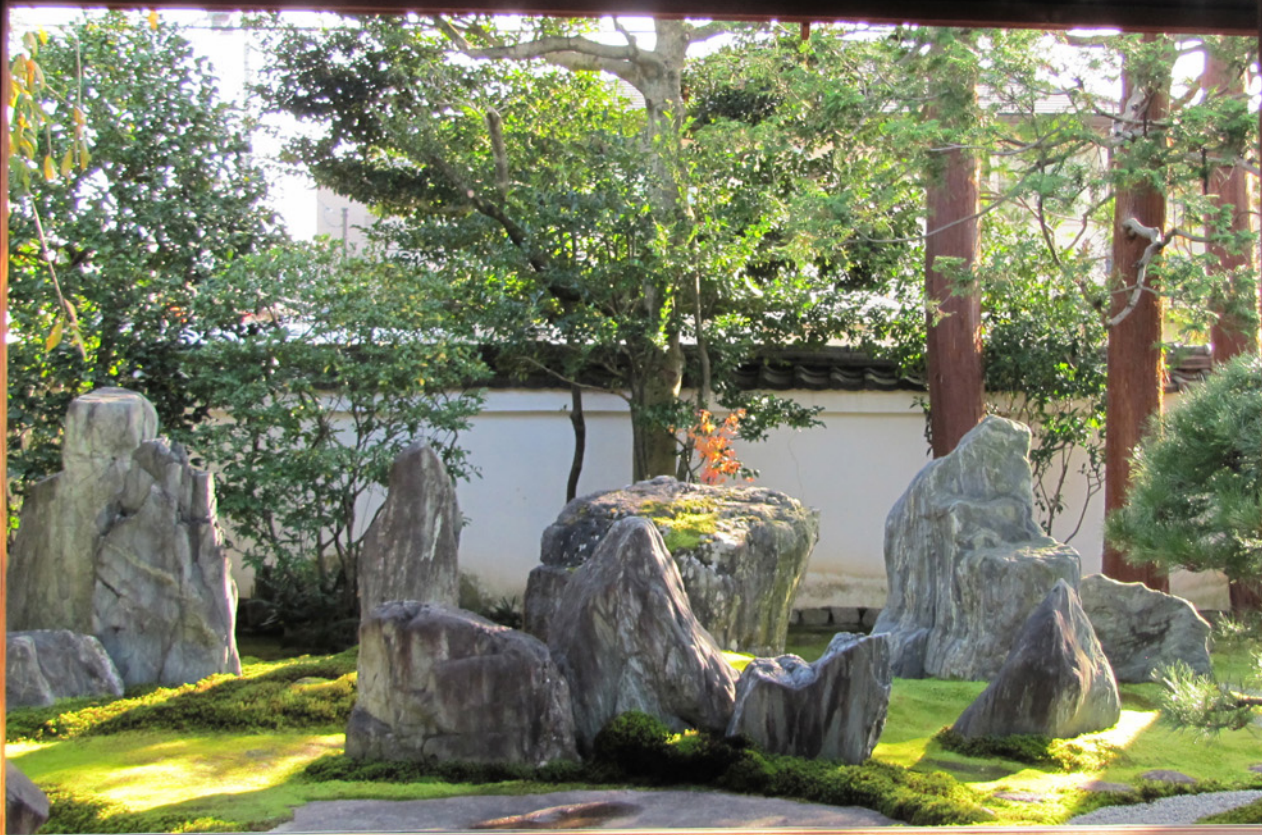
vrt Mireija Shigemoriija Kyoto 2012