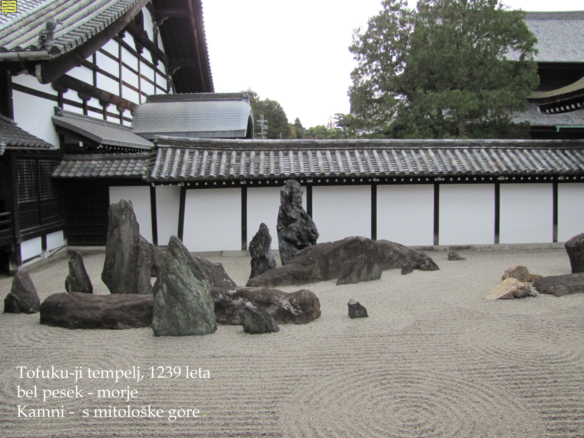
Tofuku-ji tempelj, 1239 leta bel pesek - morje Kamni - s mitološke gore